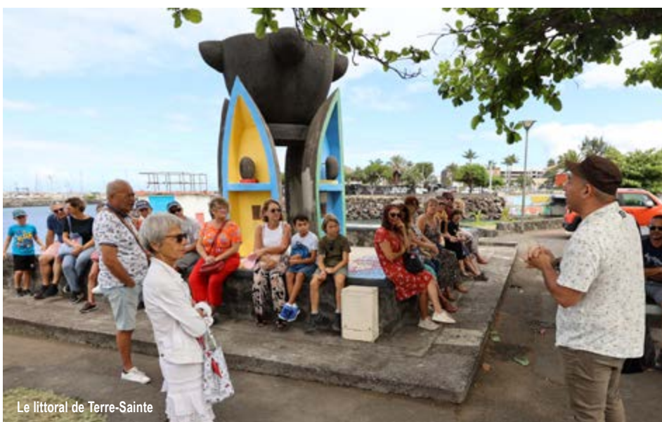
Le littoral de Terre-Sainte

Le week-end du 16 et 17 septembre s'est déroulée la 40 ème édition des journées européennes du patrimoine. Cette année, c'est le thème du patrimoine vivant qui a été retenu. De nombreuses visites gratuites ont ainsi été organisées, notamment dans les quartiers et au plus près des habitants.