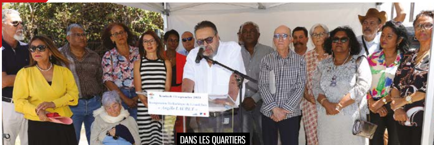
DANS LES QUARTIERS

Le 15 septembre était inaugurée la médiathèque de Grands-Bois sur le site de l'ancienne usine sucrière, fermée en 1991 et inscrite à l'inventaire supplémentaire des monuments historiques depuis 2002. Elle porte le nom d'Angelo Lauret, militant agricole et politique exemplaire.