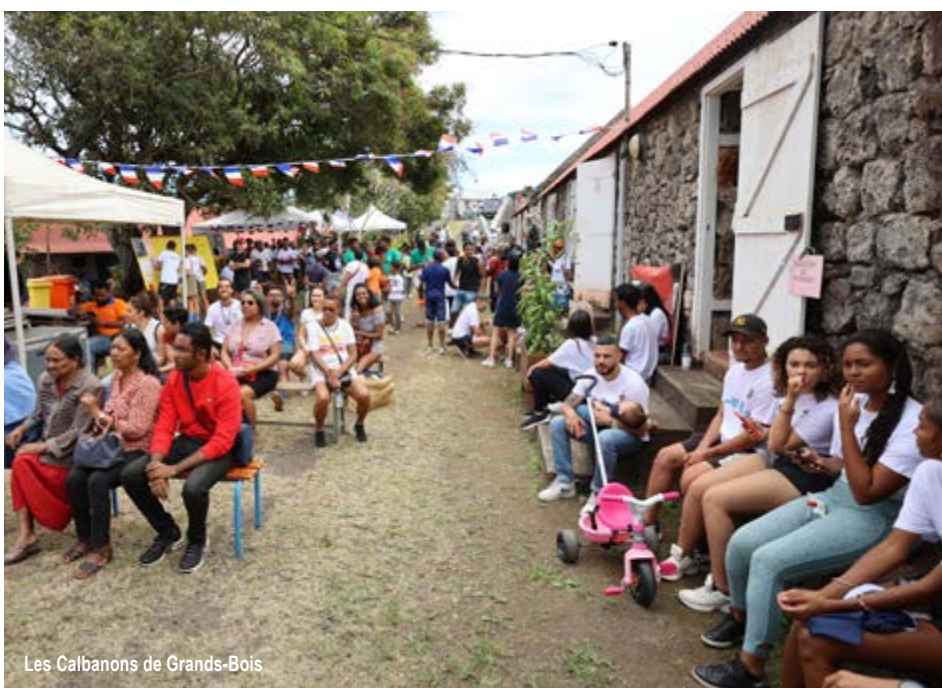
Les Calbanons de Grands-Bois

Le « patrimoine vivant », c'est donc le thème qui a été choisi pour rendre hommage aux savoir-faire, aux métiers et aux professions qui contribuent à la préservation et à la transmission de l'héritage culturel en général. On pourrait définir le patrimoine vivant comme l'ensemble des pratiques, expressions, connaissances et compétences qui se transmettent de génération en génération et qui façonnent notre identité.